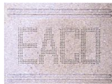
リングライト照明(倍率29×)